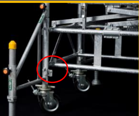
アウトリガー部 開き防止金具