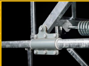
スライド金具 (樹脂リング内蔵)