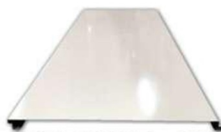
仮囲い鋼板カラーF型