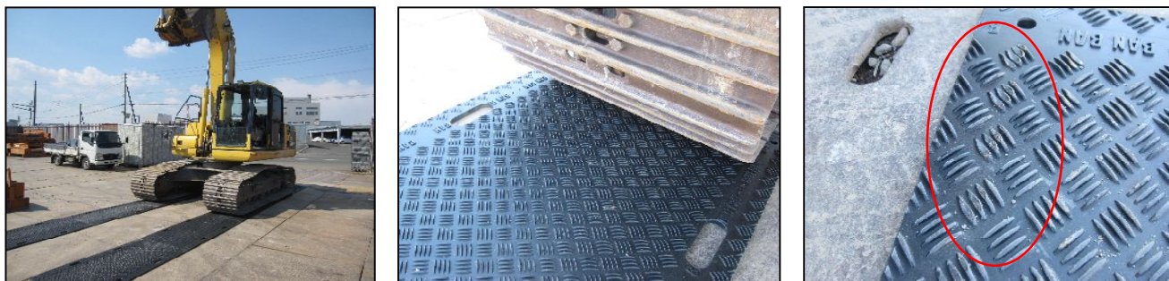
20トンのキャタピラ車で通過、直進通過ではダメージが殆ど無く、360度旋回では致命的では無いが一部にダメージが残る。