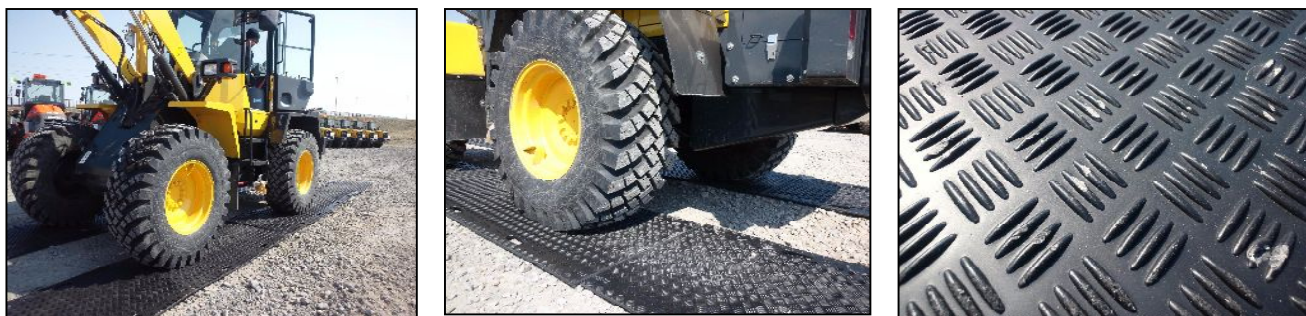
砂利の上を8トンのホイールローダで通過、タイヤ面は当然ながら、裏の砂利側にも大きなダメージはありません。